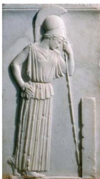
Ateńa pogrążona w żalobie, V w. p.n.e.

Płaskorzeźba – rzeźba wykonana na powierzchni kamienia, drewna itp.